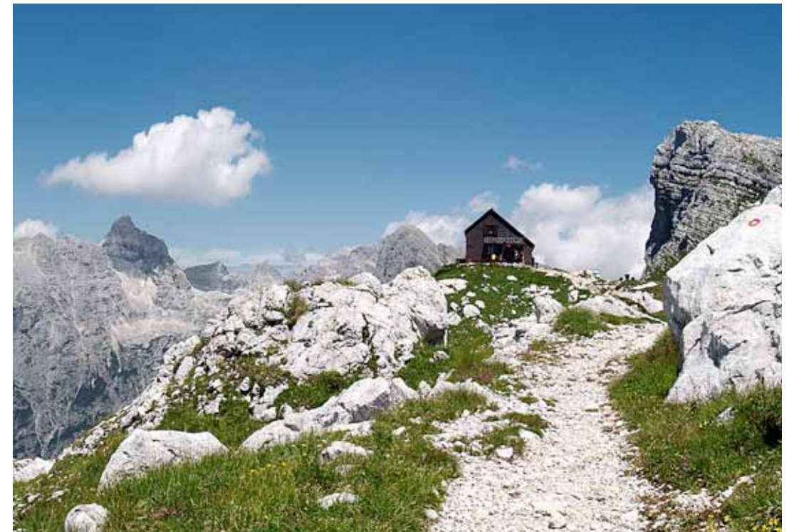
> Izrazita podoba Razorja levo zadaj s Prehodavcev.

Razor je eden od najlepših velikanov Julijskih Alp, drzno postavljen ob bok širokemu Prisojniku. Vrh ima obliko strme in vitke konice. Njegova elegantna podoba nas očara s Prehodavcev ali Kanjavca, nič manj privlačen pa ni pogled na severno steno iz Kranjske Gore. Pristop je razmeroma lahek, saj nas na Razor pripeljejo markacije, vendar je z vseh strani precej dolg. Največ obiskovalcev se ga loti s prelaza Vršič, nekaj s severa iz doline Krnice, malo manj iz doline Vrat, tu pa je opisan dostop z juga iz Trente. »Razorjeva« koča je Pogačnikov dom na Kriških podih, 2050 m, ki nam lahko bistveno olajša dolgi pristop. Postavljena je na razglednem kraju sredi visokogorskega kraškega sveta. V treh kotanjah so skrita tudi tri prikupna gorska jezera. Zgornje Kriško jezero je najvišja stalna voda v Sloveniji (2158 m).