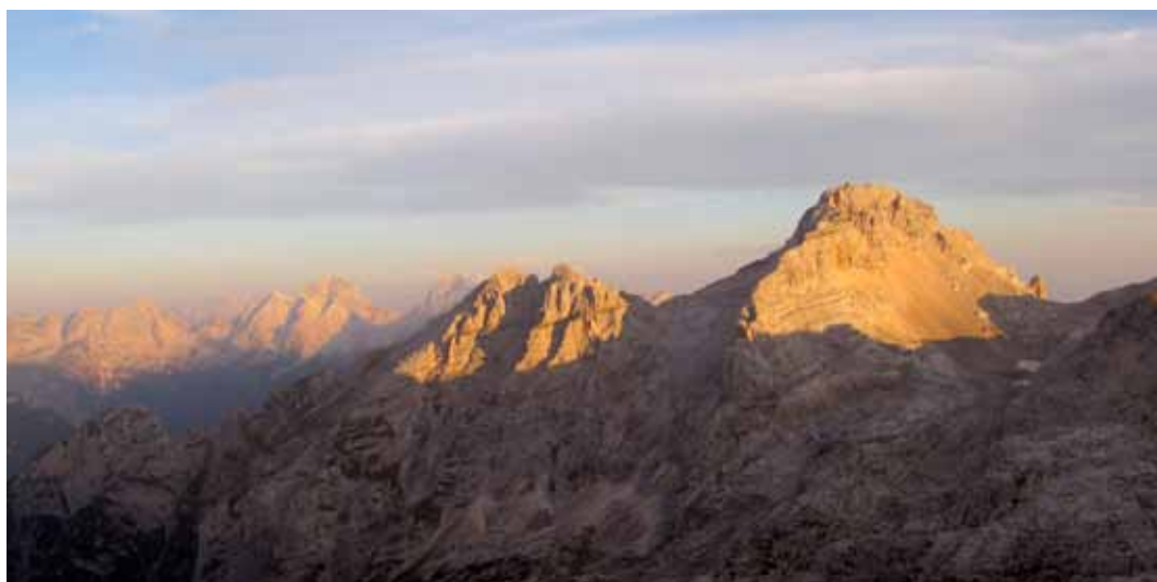
> Planja (levo) in Razor.