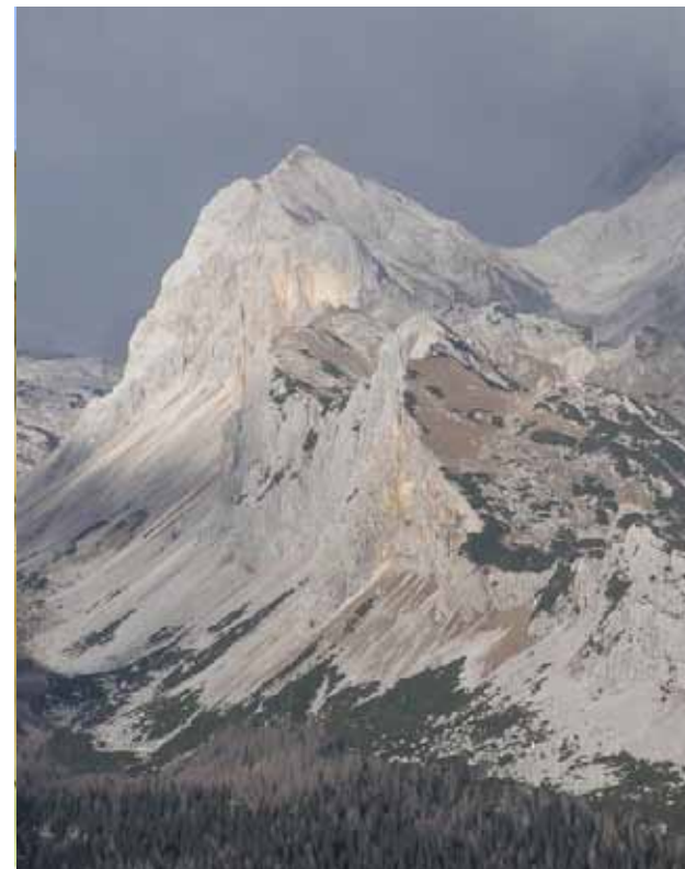
> Vzpon po zavarovani poti zahteva ustrezno izkušnost.

Od doma se spustimo po udobni poti do Konjskega sedla, 2020 m, kjer je križišče. Z leve se nam pridruži pot s Kredarice, levo lahko sestopimo v dolino Krme, nadaljujemo pa desno vzdolž pobočja Vernarja proti Vodnikovemu domu nad Velim poljem. Eni najprometnejših gorskih poti pri nas proti Rudnemu polju na Pokljuki (glej izlet številka ?) sledimo še slabe pol ure, dokler ne zavije levo okoli Tosca. Tu se obrnemo desno po označeni poti proti Vojam. Spustimo se v široko dolino in po njej v gozdnat svet na nasprotni strani. Prek planin Zgornja in Spodnja Grun-