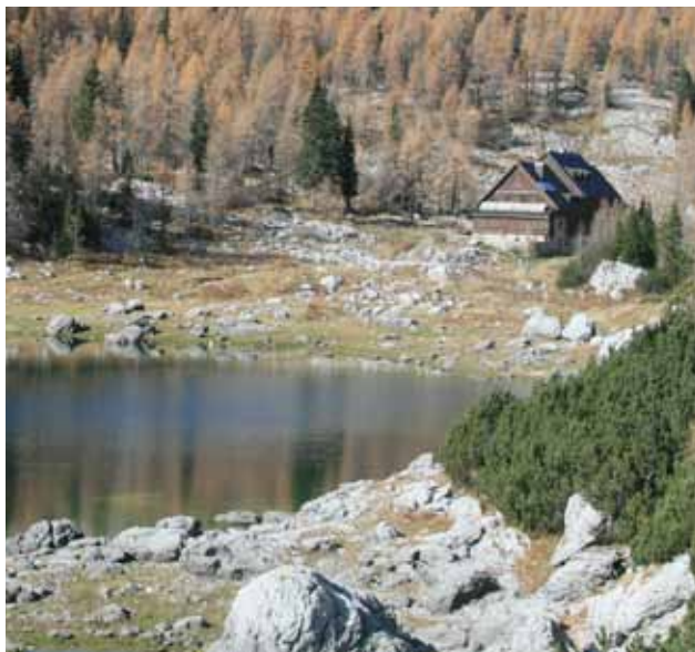
> Vzpon po zavarovani poti zahteva ustrezno izkušnost, uporabo čelade in samovarovanja.

Dolina nad kočo je en sam razkošen vrt gorskega cvetja, pravo Zlatorogovo kraljestvo. Zložno hodimo med zelenjem in skalovjem med vedno redkejšimi macesni. Desno nad nami se vzdigujejo stene Kopice in Zelnaric, levo pa vzhodna pobočja Velikega Špičja. Levo pod sabo kmalu zagledamo največje jezero Ledvičko. Tu ne rastejo več niti najtrdoživejši viharniki, visokogorsko skalovje in višina so premagali rastlinje.