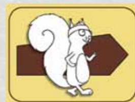
Pot po Gozdni učni poti Onger nam kaže prikupna ververica.

obutev in tudi pohodne palice. Nevarnejši odsek je na mestu, kjer se pot približa robu trzinskega kamnoloma. Tam je sicer dobro razgledišče zdaj zaščiteno z varnostno ograjo, vendar vsem obiskovalcem svetujemo previdnost in da naj se ne približujejo robu prepada.