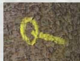
Na poti boste naleteli na nenavadne "markacije". Gre za oznako poti po mejah občine Trzin, predstavlja pa znamenito "trzinsko sekirico".

Izdala in založila: Občina Trzin Besedilo: Zdenka Oblak, Miro Štebe Trasa poti: Janez Mušič Avtorica maskote: Jana Urbas Zemljevid in skica: Krešimir Keresteš, MapDesign d.o.o. Oblikovanje: Emil Pevec Tisk: Tiskarna Ravnikar, Domžale Naklada: 3000 izvodov Trzin, 2012