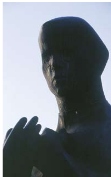
Bronasta podoba preroškega Simona Gregorčiča na spomeniku v Kobaridu

Narava je blagodejno prekrila smrt in razdejanje, sledovi vkopavanja in betoniranja pa so ostali. Dostop do položajev je danes lahek. Iz denarja Evropske unije in prispevkov fundacije »Poti miru v Posočju« in s prizadevanjem Kobariškega muzeja je alpska trdnjava spremenjena v muzej na prostem. Utrjeni položaji so rekonstruirani z originalnimi materiali: skrilami, kovinskimi mrežami, betonskimi strelnimi linami, valovito pločevino, vrečami peska ... Lahko se smukate po teh hodnikih smrti in iz duše odganjate svojevrstno pretresenost. Iz strelnih gnezd ponekod rastejo čudovite breze, ki kakor v ruskih filmih simbolizirajo mir padlih vojakov. Prehodi so zidani ozko. Kakšen debeluh bo pomislil: ti laški oficirji pa so bili res suhi ... No, meja je danes mirna, pota so mirna in označena. Seveda pa se po njih plazijo tudi občutki podzavestne, atavistične nevarnosti.