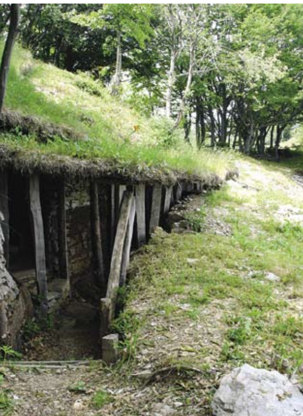
Spomeniško ohranjeni italijanski položaji iz prve svetovne vojne

Maja leta 1915, v prvih dneh bojev na Soči, so italijanski gospodarji vojne prestopili takratno avstrijsko-italijansko mejo le za kakšnih sto metrov in se že ustavili na svojem dveinpolletnem opazovalnem položaju. Medtem ko so