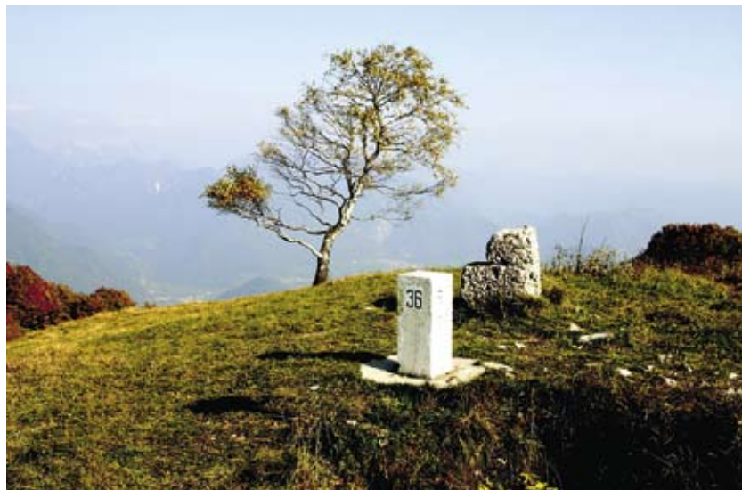
Meja na Kolovratu je razgledna na obe strani, posoško in beneško.

sega daleč v obzorje vzhodnih in zahodnih Julijcev. Kakor da bi opazovali velik relief v Kobariškem muzeju, ki označuje frontne položaje v prvi svetovni vojni, tako je razloženo skoraj vse posoško zemljišče, tako na dlani. Vendar pa, kajpada, s Kolovrata je Posočje videno bolje kot v muzeju, v živo, v sončnih kopelih dolin in igri oblakov nad njimi. Morda je to eden najlepših slovenskih razgledov. Počitniško naselje, zgrajeno po odličnem projektu arhitekta Roka Klanjščka, je na tem mestu poimenovano po nebesih. Gostje Nebes, tu nad Livkom, so blaženi ujetniki kolovraškega razgleda.