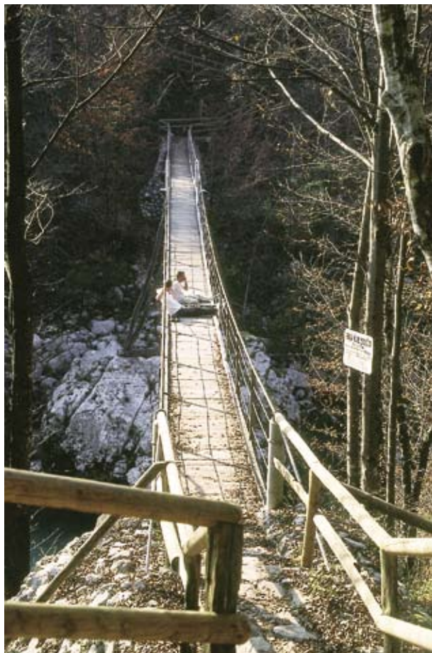
Užitkarski počitek nad Sočo

Valovi šumne Soče se na videz kakor da nadaljujejo v slikovito valujočih skladih fliša na stenah obrežja. Fliš je igračkasto zvit, banjast, poskočen in natrgan. V njegovih skladih se menjujeta trd in debelejši peščenec ter mehki, tanjši lapor. V strugi je Soča odplavila lapor in se ulegla na peščenčevo postelj. Kar nam jemlje dih zaradi lepote, je pravzaprav brezčasni znanstveni laboratorij; in geologija je tu poezija. Iščeš besede po velikem slovarju kameinja in vode.