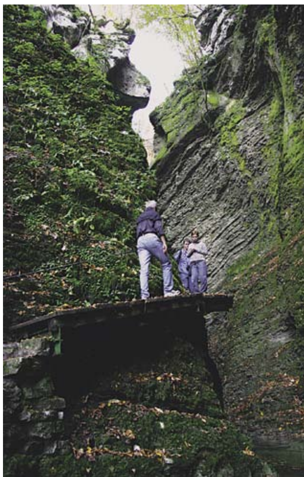
H Kozjaku se pride po drzno speljani poti.