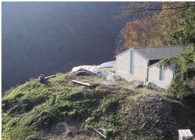
Na območju Tonovcovega gradu nastaja zanimiv arheološki park.

Najprej so le stopnice, vojaške stopnice. So izredno gradbeno delo italijanskih inženircev iz prve svetovne vojne. In tudi nekaj napol zasutih hodnikov se vije na južnem delu Tonovcovega gradu. Bili so del nemških obrambnih položajev leta 1945; so pravzaprav jarki med strojničnimi in minometnimi gnezdi. Kaj pa stene gradu? Odkopanih in že osušenih zidov je kar nekaj. Na veliki arheološki tabli, ki te pozdravi na vhodu v Tonovcov grad, pa je vrisanih še veliko neodkopanih zidov. Hitro ugotoviš, da si se znašel na arheološkem najdišču, da si priča velikemu