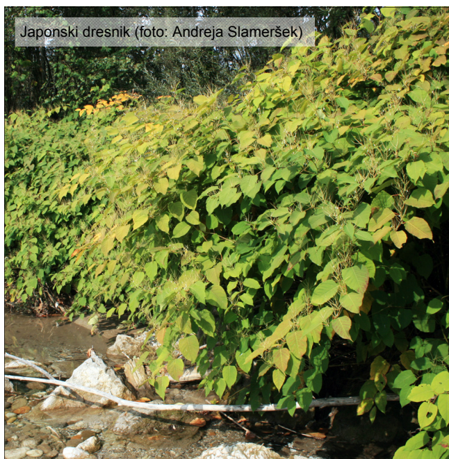
Japonski dresnik

Udeležba na čistilni akciji je na lastno odgovornost! Organizatorji ne prevzemamo odgovornosti za morebitne poškodbe in nezgode na čistilni akciji!